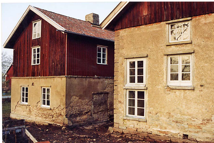
Gavlarna mot söder med nyrenoverade fönster. Okt. 2003.