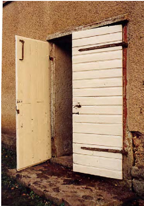
Pardörrarna till västra huset lagade och målade. Okt. 2003.