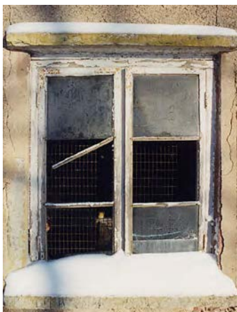
Vänster och nedan: 2003 års arbeten berörde huvudsakligen fönstren, som var i generellt dåligt skick. Jan. 2003.