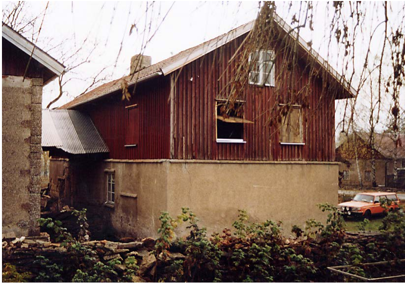
Norra gaveln med luckorna till magasinet efter renovering. Okt. 2003.