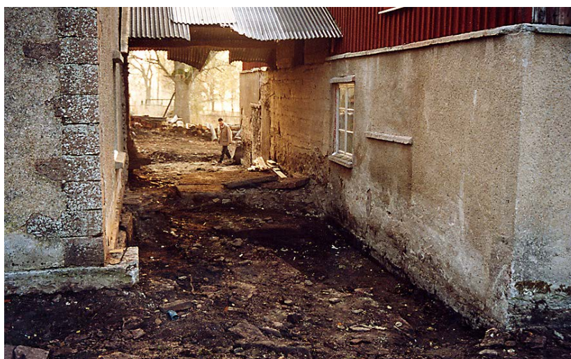
Utrymmet mellan husen klart i väntan på den nya mellanbyggnaden. Okt. 2003.