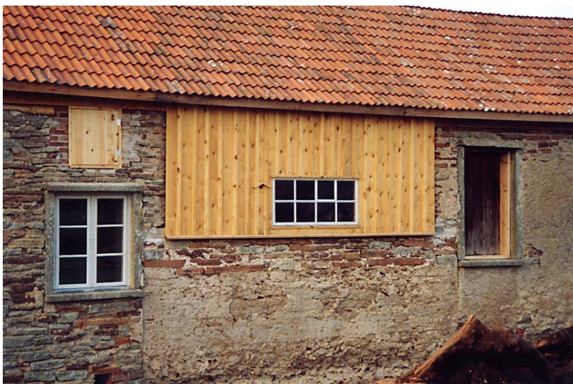
Ny locklistpanel i stället för den gamla som hade fallit sönder. I den monterades ett äldre fönster, tillvarataget från Rörstrands fabriker i Lidköping.