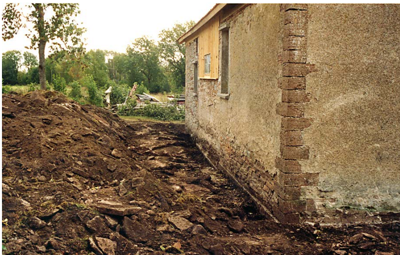
Grävning runt husen för dränering. Mycket vatten rinner periodvis under husen uppifrån berget. Sep. 2003.